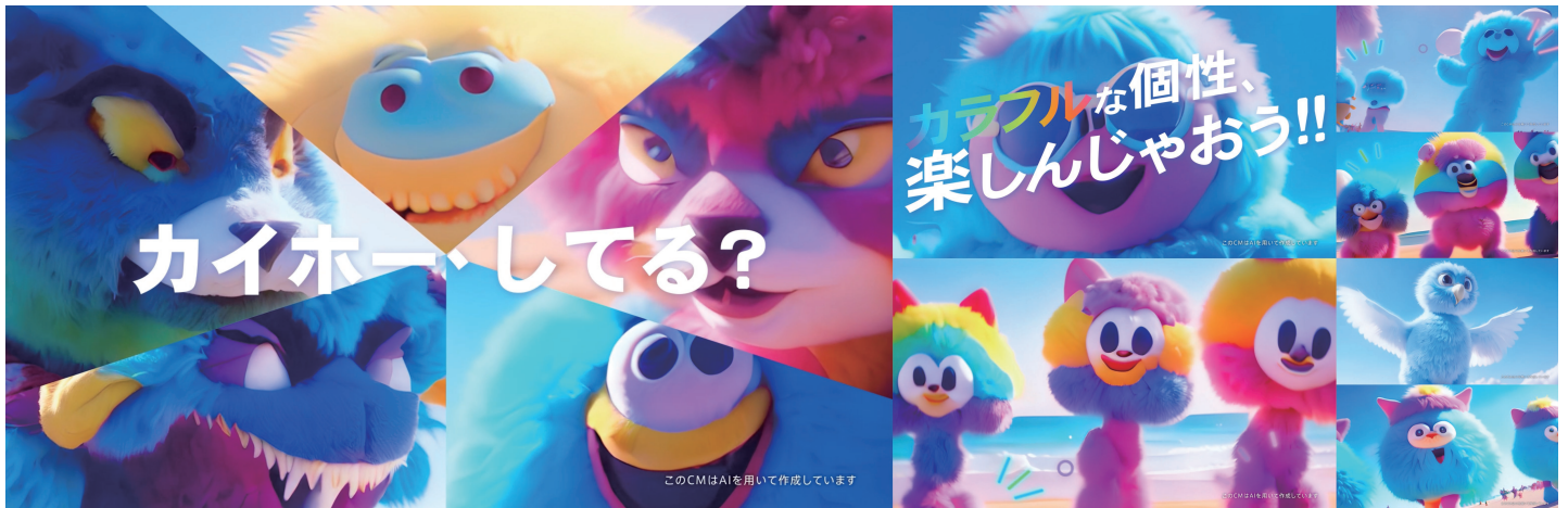
03：多様性編 | かいほーしてる？