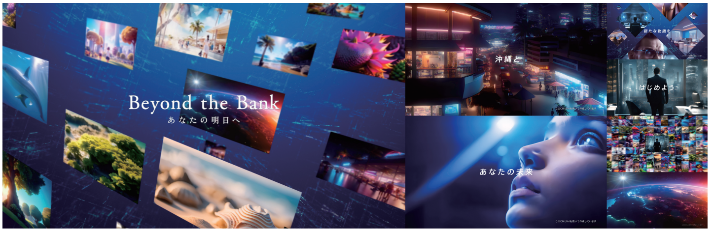
01：近未来編 | 沖縄の未来