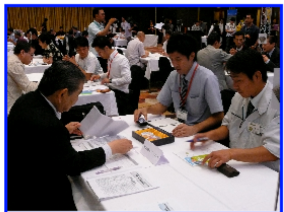
<昨年実施した「沖縄の味力発信商談会の様子」>