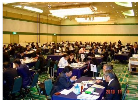
個別商談会のイメージ