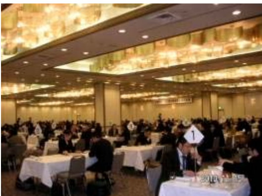
商談会のイメージ